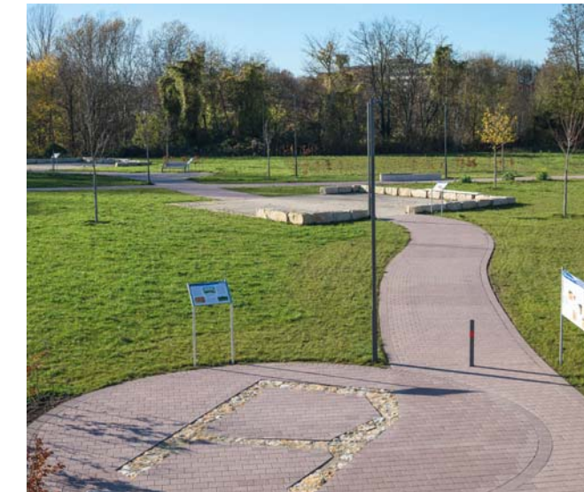
Archäologiepark in Bad Krozingen mit den rekonstruierten Grundrissen des römischen Gutshofes und einer steinzeitlichen Grabkammer.

Anmeldung: Kulturamt Bad Krozingen, Tel.: 07633/407-169, E-Mail: kulturamt@bad-krozingen.de