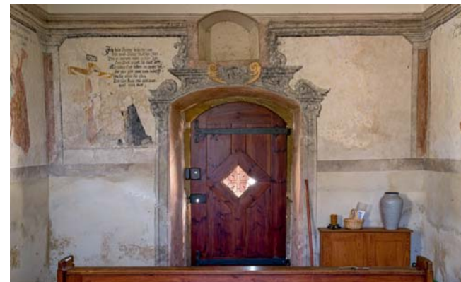
Die Magdalenenkapelle