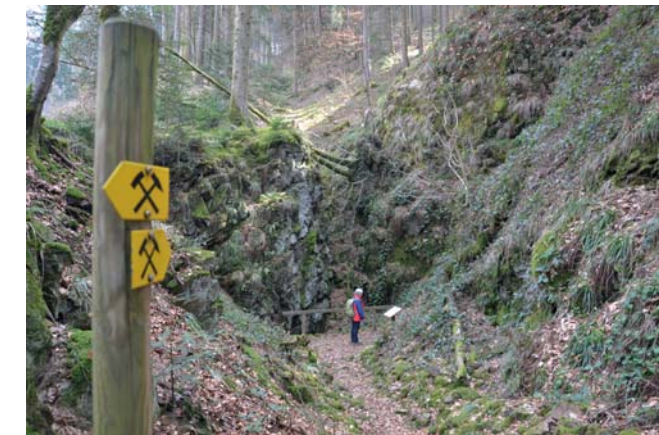
Verhau (Tagebau) am Birkenberg

Teilnahmegebühr: 5,00 €, Kinder bis 16 Jahren frei. Anmeldung nicht erforderlich.