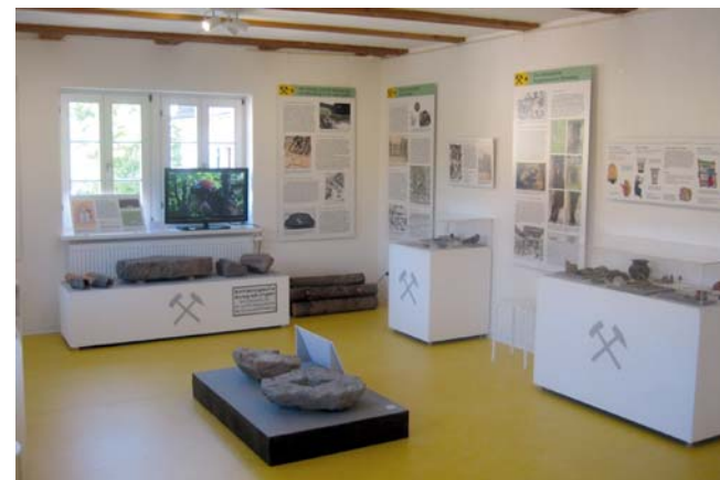
Die Ausstellung im „Alten Rathaus“ in Bollschweil

Sonntag, 16. April 2023, 15:00 Uhr Sonntag, 21. Mai 2023, 15:00 Uhr Sonntag, 18. Juni 2023, 15:00 Uhr Sonntag, 16. Juli 2023, 15:00 Uhr August: Sommerferien keine Führung Sonntag, 17. September 2023, 15:00 Uhr Sonntag, 15. Oktober 2023, 15:00 Uhr Sonntag, 19. November 2023, 15:00 Uhr Anmeldung nicht erforderlich.