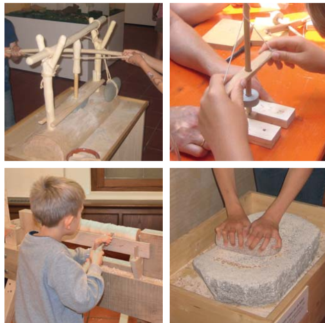
Altes Handwerk von der Steinzeit bis zum Mittelalter

Samstag 17. Juni 2023, 15:00 Uhr Exkursion zur Magdalenenkapelle in Staufen